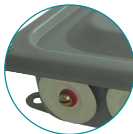
РИС. 1. КЗН 08-10

имеют отверстия, закрытые металлическими заглушками, которые при необходимости снимают и устанавливают уплотнительные резиновые втулки или привертные сальники.